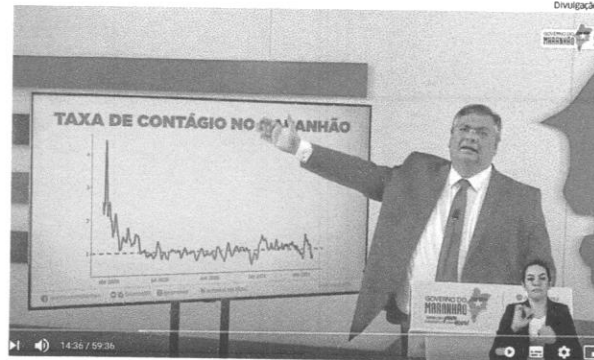
Flávio Dino apresentou dados sobre o atual panorama do enfrentamento da pandemia no estado

meio ao imbróglio sobre a autorização para a importação do imunizante, o Instituto Gamaleya encaminhava aos estados na sexta-feira novos documentos que tratam da eficácia e da segurança da vacina.